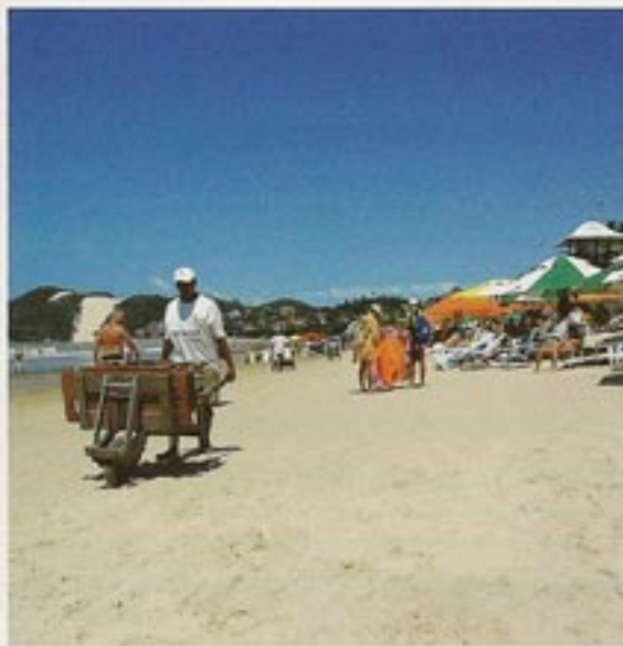
NATAL VAR det første ferieboligmarkedet i Brasil som fanget nordmenns oppmerksomhet. Etter skandalene rundt B-gjennegens eskapader i området fikk den norske interessen en alvorlig knekk, men vi tror også Natal kommer sterkt tilbake.

På nettet: www.brasil.gov.br/ingles , www.brasiltour.com